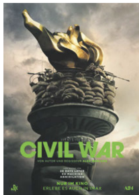
CIVIL WAR Genres: Action, Drama