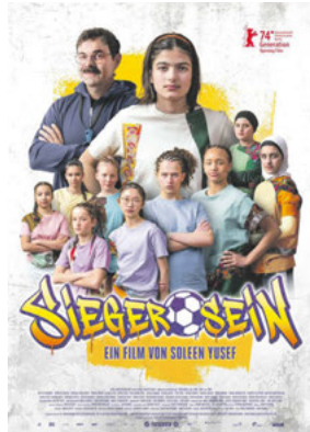
SIEGER SEIN Genres: Familie, Drama