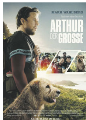
ARTHUR DER GROSSE Genres: Abenteuer, Familie