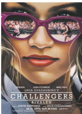
CHALLENGERS - RIVALEN Genres: Romanze, Drama