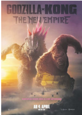
GODZILLA X KONG: THE NEW EMPIRE Genres: Action, Fantasy