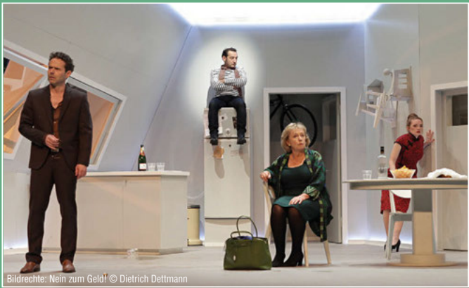
Nein zum Geld!

Samstag, 7. Oktober 2023 Stadthalle Walsrode 20:00 Uhr