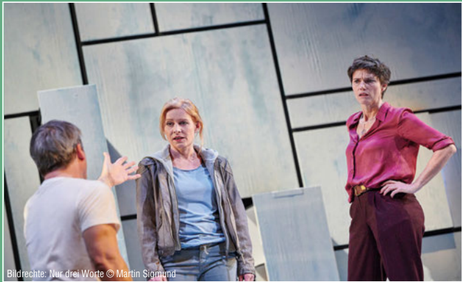
Bildrechte: Nur drei Worte © Martin Sigmund

Eine Hommage an sein Leben und seine größten Hits