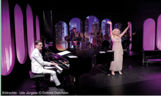
Udo Jürgens

Samstag, 2. Dezember 2023 Stadthalle Walsrode 20:00 Uhr